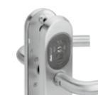
ES 3: 17.320.70 Eypos HZ-lock