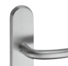
ES 3: 5439.3-ZA