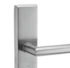
ES 2: 6167.2-RS