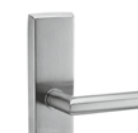
ES 1: 6155