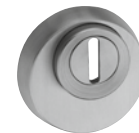
ES 1: 5330.2S-ZA