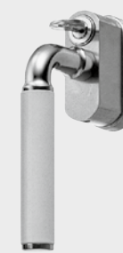
Abschliessbare Fensterrosette 5617, geprüft nach ENV 1627 1999-04

Die Erfahrung zeigt, dass potenzielle Einbrecher oft schnell aufgeben, wenn sie auf Probleme stossen.