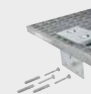
Gitterrostversicherung 9103 Verhindert das Abheben von Lichtschachtgittern. Auch geeignet für Notausgänge von Luftschutzräumen.

Geeignet für den Einsatz in Balkontüren und einbruchhemmenden Fenstern sowie für Schliessanlagen, kombinierbar mit fast allen Glutz Fenstergriffen. Auch einsetzbar als Kindersicherung.