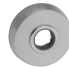
ES 1: 5630S