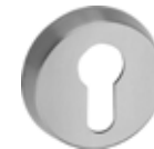
ES 1: 5330S