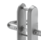
ES 3: 5466