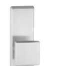
ES 3: 6161.2-ZA