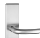
ES 3: 6161.2-ZA