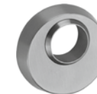
ES 1: 5330.2S-RS