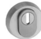
ES 1: 5330.3S-ZA